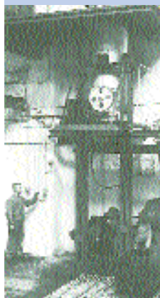
Παραγωγή ινών με το φημισμένο 'Mason canon'

Στην υγρή μέθοδο παραγωγής της σκληρής ινοπλάκας, οι ίνες περνούσαν μέσα από κόσκινα σε μορφή αιωρήματος ινών. Το 1914, η εταιρία Leikam-Josephstal AG στη Βιέννη είχε την ιδέα να στρωματώσει τις ίνες με τη βοήθεια του αέρα. Ωστόσο, η ιδέα του πρωτοπόρου Weyerhaeuser στις ΗΠΑ στάθηκε τότε φανταστική, αφού ήταν ο πρώτος που ανέπτυξε την "ημι-ξηρή" μέθοδο (semi-dry