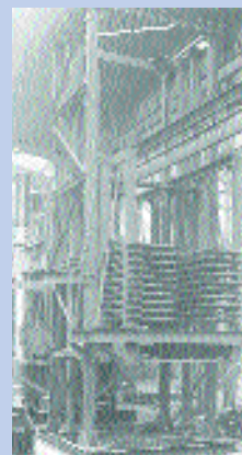
Πρωταρχικός τύπος θερμής πρέσας συμπίεσης

process) το 1943, καθοδηγούμενος από το ερευνητικό ινστιτούτο Plywood Research. Το 1951 άρχισε η παραγωγή της ινοπλάκας με την "ημι-ξηρή" μέθοδο από τη βιομηχανική εταιρία Anacores Veneer. Κατά την "ημι-ξηρή" μέθοδο, οι ξυλώδεις ίνες προτού συμπιεστούν είχαν μία μέση υγρασία 20-35%.