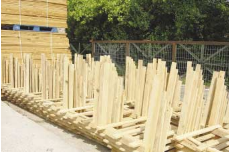
Ημιέτοιμα μέρη κιβωτίων που προορίζονται για θερμικό χειρισμό

στη νέκρωση των παθογόνων που πιθανά περιέχει το ξύλο. Μετά από οποιοδήποτε από τους παραπάνω χειρισμούς το μέσο συσκευασίας θα πρέπει να σφραγιστεί με μόνιμη σήμανση από την οποία θα δηλώνεται ο τρόπος που έγινε η νέκρωση των παθογόνων (π.χ. HT Heat Treatment - Θερμικός χειρισμός), ο χαρακτηριστικός αριθμός της εταιρείας που έκανε το θερμικό χειρισμό καθώς και η χώρα παραγωγής.