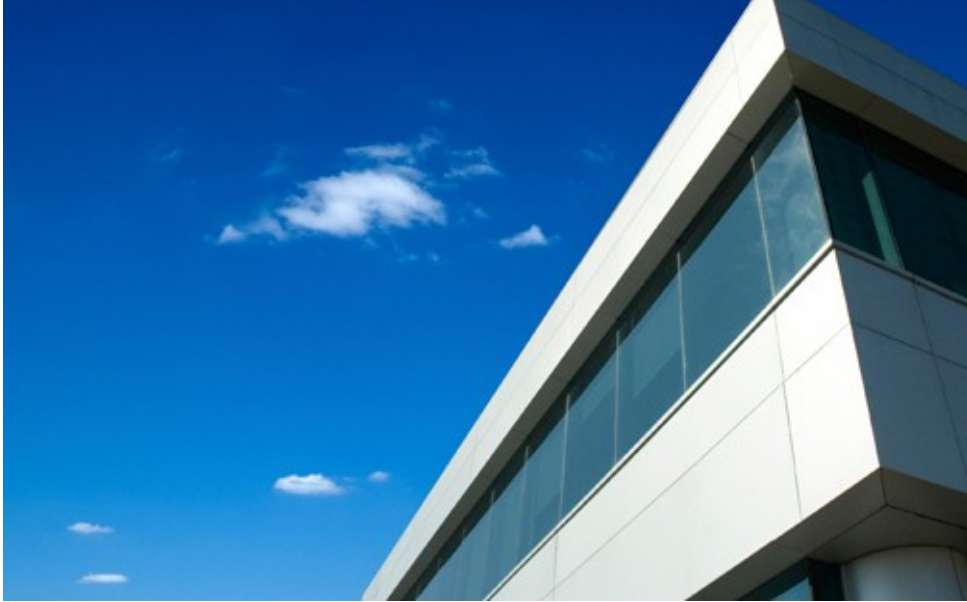
Εικ. 2. Εφαρμογή του Tricoya σε εξωτερικές ξυλεπενδύσεις

Αυτή είναι η τεχνολογία Tricoya και βέβαια απομένει να αποτιμηθούν στην πράξη, πέραν των παραπάνω, και παράγοντες όπως κόστος χρήσης τέτοιου είδους προϊόντων και θέματα που αφορούν τα παραπροϊόντα της τεχνολογίας (βλ. οξικό οξύ) όπως και η μεγάλη διάρκεια ζωής των προϊόντων αυτών σε ακραία κλιματικά περιβάλλοντα (π.χ. ελληνικές κλιματικές συνθήκες).