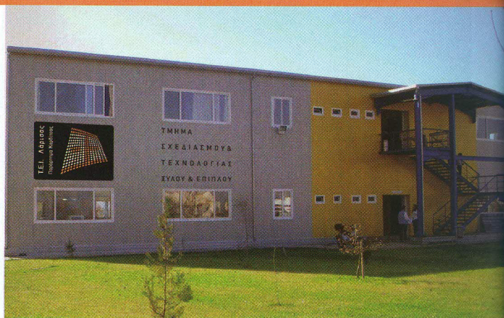
Οι σύγχρονες εγκαταστάσεις του Τμήματος στο Παράρτημα Καρδίτσας (ΤΕΙ Λάρισας)

Απ: Όπως γνωρίζετε, το μοναδικό αυτό τμήμα ΤΕΙ ιδρύθηκε μετά από ιδέα και πρωτοβουλία του εξαιρετικού συναδέλφου Καθηγητή Ι. Κακαρά (του οποίου το έργο και την προσφορά αναγνωρίζουμε σε μέγιστο βαθμό) και άρχισε τη λειτουργία του το 1999 και με πλήρη αυτοδυναμία το 2002, όταν κι