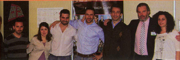
Με την ομάδα του Τμήματος στην έκθεση Medwood 2012