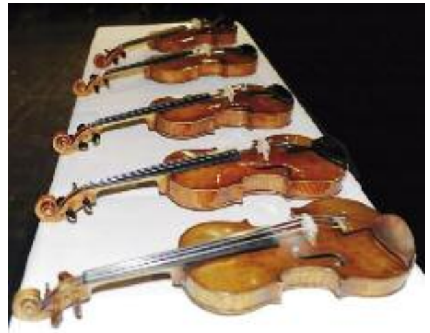
Εικ. 2 Βιολιά κατασκευασμένα με αυτή την επαναστατική τεχνική του Empa

Το ερευνητικό αυτό πρόγραμμα χρηματοδοτείται από το μη κερδοσκοπικό ίδρυμα Walter Fischli και η ομάδα των ερευνητών Dr Iris Bremaud & Dr Francis Schwarze ευελπιστεί να ολοκληρώσει και να τελειοποιήσει αυτή τη νέα τεχνολογία. Τα πρώτα αποτελέσματα (εικ. 2) από διαγωνισμό ακουστικής που