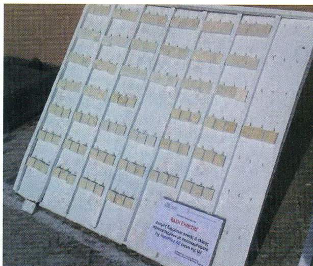
Εικ. 3: Έκθεση των δειγμάτων σε εξωτερικές συνθήκες

για χρόνο 10 sec. Τα δοκίμια αφού κλιματίστηκαν (Εικ. 2), τοποθετήθηκαν σε 2 κατάλληλες βάσεις έκθεσης που κατασκευάστηκαν στο Τμήμα και εκτίθενται (εξωτερικά) στις εγκαταστάσεις του Τμήματος (Εικ. 3, ταράτσα - πειραματική περιοχή). Η διάρκεια έκθεσης θα πραγματοποιηθεί για χρονικό διάστημα 10 μηνών. Ανά τακτά χρονικά διαστήματα για τροποποιημένη ξυλεία (1, 2, 3, 5, 10 μηνών) και για πεύκο & έλατο (1, 3, 5, 7, 10 μηνών) κατά τη διάρκεια της γήρανσης πραγματοποιούνται με σύγχρονο χρωματόμετρο του TEI οι προσδιορισμοί των χρωματικών μεταβολών.