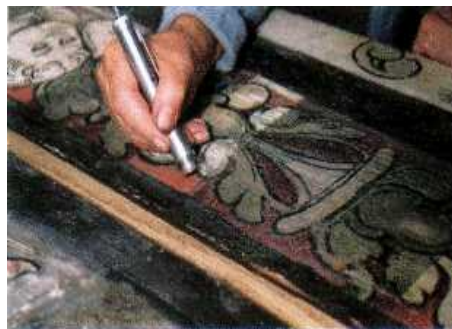
Εικ. 2. α. Πηγή ακτίνων Laser (ReNOVALaser 1)

β. Δοκιμές καθαρισμού πολυχρωμίας με ακτίνες Laser.