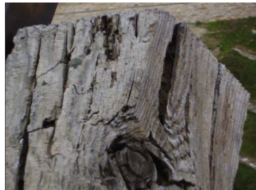
Εικ. 1. Μονές Μετεώρων: οι κατασκευές ξύλου υφίστανται γήρανση από τη συντονισμένη επίδραση των εξωτερικών παραγόντων.

Όλοι αυτοί οι παράγοντες που προκαλούν τη γήρανση του ξύλου βρίσκονται σε μια συνεχή δυναμική αλλαγών και το αποτέλεσμα της επίδρασής τους στο ξύλο δεν μπορεί να μελετηθεί και να εκτιμηθεί από τη μελέτη κάθε παράγοντα (μεταβλητής) χωριστά (Δασακλή 2000, Tsoumis 1991, Lavier 2007) αλλά από τη συνδυασμένη επίδραση πολλών παραγόντων μαζί (Tsakanika 2005). Συνεπώς, σύμφωνα με την άποψη αυτή κάθε κατασκευή ξύλινου αντικειμένου πρέπει να αντιμετωπίζεται ως μοναδική, που αντιπροσωπεύει το αποτέλεσμα της αλληλεπίδρασης μεταξύ των αρχικών συνθηκών κατασκευής και μιας ομάδας φυσικομηχανικών και φυσικοχημικών χαρακτηριστικών. Τα δεδομένα αυτά κατά τη διάρκεια χρήσης του ξύλινου αντικειμένου τέχνης δημιουργούν περίεργες και αλλόκοτες επιδράσεις