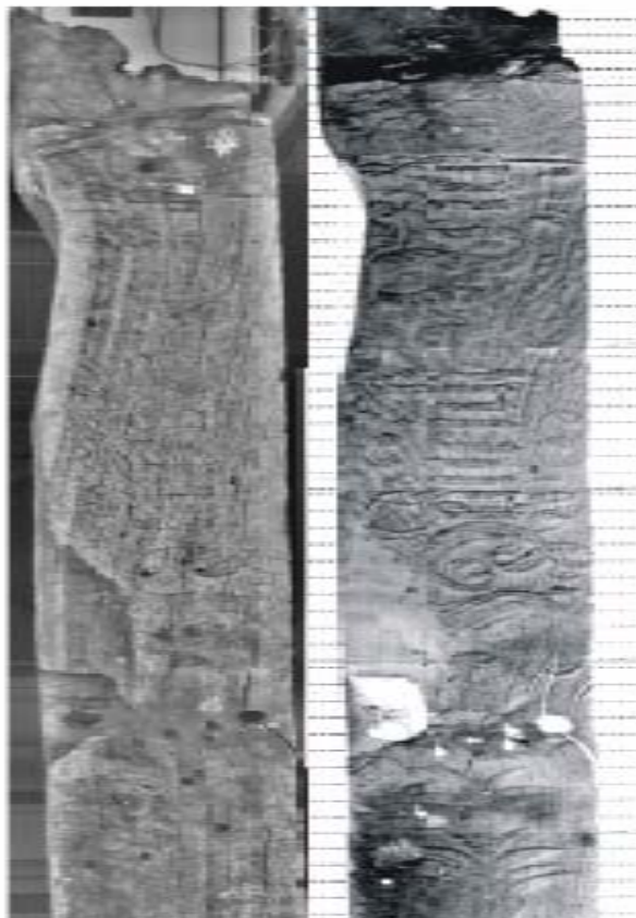
Εικ. 3. Υπέρυθρη θερμογραφία ξύλινης δοκού κτιρίου, που αποκαλύπτει την υποβάθμιση της ξυλόγλυπτης παράστασης (Brocke 2007).

Για τη μελέτη πολύτιμων ξύλινων αντικειμένων, συχνά είναι απαραίτητη η διάγνωση της εσωτερικής κατάστασης του αντικειμένου χωρίς την πρόκληση φθοράς. Αυτό βοηθάει στην επιλογή των κατάλληλων μεθόδων συντήρησης και αποκατάστασης. Μια τέτοια μέθοδος είναι η εφαρμογή της υπέρυθρης θερμογραφίας. Κατά τη μέθοδο αυτή το ξύλινο αντικείμενο δέχεται θερμική παλμική ακτινοβολία και ταυτόχρονα γίνονται λεπτομερείς παρατηρήσεις του ξύλου μέσω κάμερας υπέρυθρης ακτινοβολίας. Οι διαφορές στη θερμική αγωγιμότητα και την ποσότητα της θερμικής ακτινοβολίας στα διάφορα σημεία στο εσωτερικό του αντικειμένου αποτυπώνονται στη θερμογραφία και αποκαλύπτουν την εσωτερική κατάσταση του ξύλου, π.χ. προσβολές εντόμων, μυκήτων, ύπαρξη μεταλλικών αντικειμένων, αποκολλήσεις, ρωγμές (Εικ. 3). Η μέθοδος αυτή προτείνεται ως εναλλακτική και καλύτερη μέθοδος αποτύπωσης των φυσικών ιδιοτήτων από τις μεθόδους υπερήχων και ραδιομετρικών ακτίνων. Τυπικές εφαρμογές της μεθόδου είναι ο χαρακτηρισμός των διακοσμητικών ενθεμάτων, ο έλεγχος ξύλου εικόνων και έργων ζωγραφικής και ο έλεγχος δομικού ξύλου (Brocke 2007).